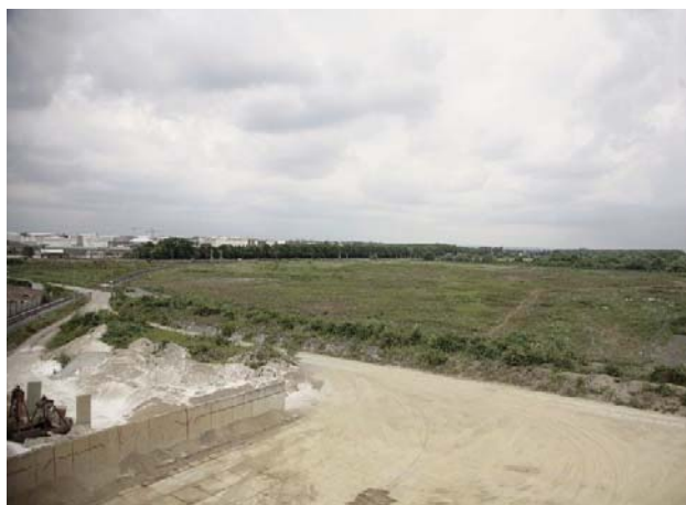
Auf dieser Industriebrache soll der Containerhafen in Godorf gebaut werden

www.hafen-fuer-koeln.de freigeschaltet, die über Hintergründe, die Bürgerbefragung, Pro- und Contras informiert und die Aussagen von Bürgerinnen und Bürgern wiedergibt. Diese Informationen werden auch in türkischer Sprache angeboten, um so einen Großteil der Kölner Bevölkerung mit Migrationshintergrund zu aktivieren. ■