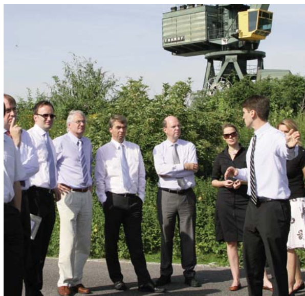
Die Vertreter der ARBEITGEBER KÖLN informieren sich vor Ort in Godorf