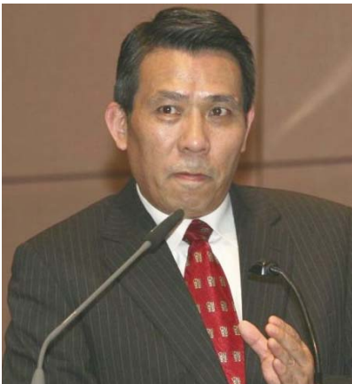
Prof. Xuewu Gu

gibt, der unter der Führung von Kommunisten realisiert wird. Der Schutz des Privateigentums ist in der chinesischen Verfassung festgeschrieben. Wettbewerb als das Leitprinzip des wirtschaftlichen Lebens setzt sich im Reich der Mitte durch. „Aber China, erstartet durch sein Gewicht in der Weltwirtschaft, lässt zunehmend erkennen, dass es bei der Modernisierung des bevölkerungsreichsten Landes der Welt seinen eigenen Weg gehen will. Das westliche Demokratiemodell lehnt es bislang kategorisch ab, und eine dominierende Rolle im wirtschaftlichen Leben des Landes will die politische Klasse dem Privatkapital nicht einräumen.“