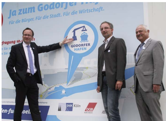
Gemeinsame Vorstellung der Informationskampagne „Ja zum Godorfer Hafen!“ durch ARBEITGEBER KÖLN, DGB und IHK